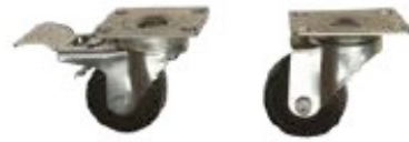
Ruote per armadio Per armadi da pavimento serie IJS, 3", con e senza freno, portata massima 100 kg ciascuna, altezza 110 mm