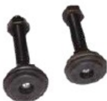
Piedini livellabili Metallico, con spazzola antipolvere, larghezza 19", Altezza 2 U