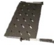
Piano estraibile Estraibile, larghezza 19", 1 U, profondità 400, 450, 600, 800, 1000 mm