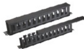
Pannello-canalina guidacavi In plastica, larghezza 19", 1 U, richiudibile, altezza 85 mm, con 12 porte per lato