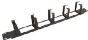
Pannello guidacavi in metallo Larghezza 19", 1 U, con 5 anelli di plastica guidacavi, altezza 75 mm, 4 asolature