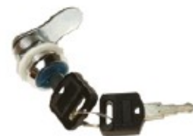
Serratura cilindrica a chiave Sistema di chiusura per armadietti serie WMA e per i fianchi degli armadi da pavimento serie JS

I prodotti oggetto del presente fascicolo tecnico sono accessori meccanici utilizzati per assemblare e cablare le apparecchiature all'interno degli armadi rack serie IJS, IWMA e IWMB.