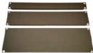
Pannello cieco metallico Larghezza 19", altezza 1 U, 2 U o 3 U