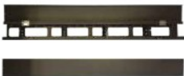
Coppia canaline guidacavi verticali Metalliche, richiudibili, altezza condotto 41 mm, per armadi da pavimento di larghezza 800 mm serie IJS da 27 U, 37 U, 42 U o 47 U