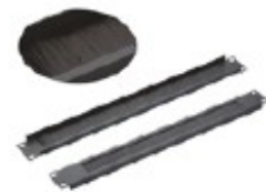
Pannello con spazzola Metallico, con spazzola antipolvere, larghezza 19", 1 U