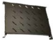
Piano regolabile Fisso, larghezza 19", 1 U, con staffe regolabili in profondità da 350 a 600, da 500 a 800, da 750 a 1000 mm