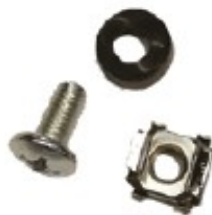
Kit dadi gabbia, viti e rondelle Kit da 50 viti M6, lunghezza filetto 12 mm, testa a croce, 50 dadi a gabbia e 50 rondelle in plastica