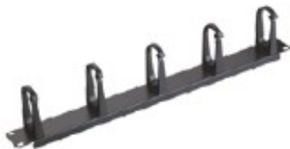
Pannello guidacavi in metallo Larghezza 19", 1 U, con 5 anelli di plastica guidacavi, altezza 75 mm