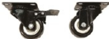
Ruote per armadio Per armadi da pavimento, per armadietti serie IWMA, 2", con e senza freno, portata massima 60 kg ciascuna, altezza 70 mm